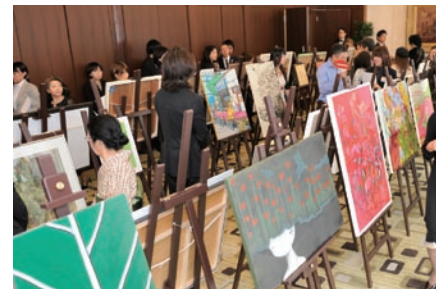
三菱商事アート・ゲート・プログラム