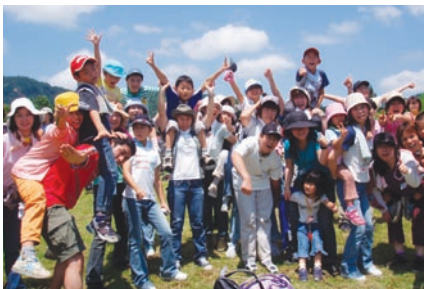
母と子の自然教室

活動（三菱商事アート・ゲート・プログラムなど）」を重点分野として、積極的に活動を推進しています。社員一人ひとりが社会貢献に対する意識を高めていくことが重要であると考え、社員のボランティア活動への参加を促進するさまざまな取り組みも行っています。