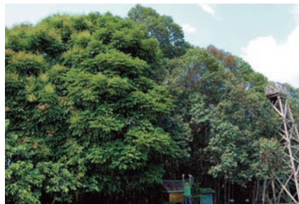
マレーシアでの植林活動