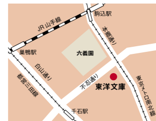
【所在地】 東京都文京区本駒込 2-28-21