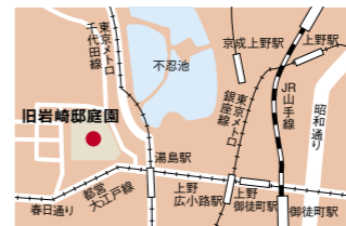
【所在地】 東京都台東区池之端 1-3-45

旧岩崎邸は1896年に岩崎家本邸として建てられました。英国人建築家ジョサイア・コンドル*によって設計されたものです。木造2階建・地下室付きの洋館は、本格的なヨーロッパ式邸宅で、近代日本住宅を代表する西洋木造建築。1階ホールには何本もの部材を組み合わせて作られた見事なトスカナ式の列柱があり、アカンサスをモチーフにしたジャコビアン様式の装飾が施されています。洋館と和館をつなぐ渡り廊下の天井は、舟底を模した舟底天井と呼ばれるつくりになっており、海運業でスタートした三菱というメッセージが込められています。