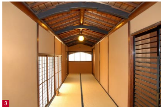
1. 洋館外観 2. トスカナ式列柱のある1階ホール 3. 渡り廊下の舟底天井