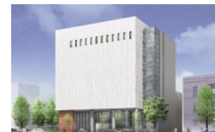
完成予想図(2010年12月竣工予定)。現在建て替え工事が行われていますが、工事期間中も閲覧室は従来通り利用することができます。

1924年、岩崎久彌(三菱第三代社長)によって設立された東洋文庫は、東洋学全般にわたる専門図書館・研究所です。国内最大で、国際的にも世界五指の一つに数えられ、東洋学の研究図書館として高く評価されています。その基礎は1917年、当時中華民国総統府顧問を務めていたG.E.モリソンの所蔵する中国関連欧文文献2万4,000冊、地図版画1,000枚にのぼる『モリソン文庫』を久彌が日本の文化・教育のために購入したことに始まります。現在の蔵書数は約95万冊。その中には国宝5点、重要文化財7点も含まれています。蔵書は現在も、年間1万冊ほどのペースで増えています。