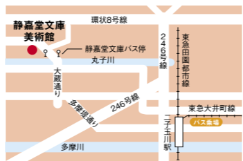
【所在地】 東京都世田谷区岡本 2-23-1

静嘉堂は、岩崎彌之助(三菱第二代社長)と小彌太(三菱第四代社長)の父子二代によって建設されました。現在、国宝7点、重要文化財83点を含むおよそ20万冊の古典籍と6,500点の東洋古美術品を収蔵しています。図書を中心とする文庫は、1892年の創設以来、和漢の古典籍の収集に努め、保存を主とした専門図書館として活動してきました。美術館は文庫創設100周年の記念事業として建設され、1992年4月にオープンしました。彌之助の収集が絵画、彫刻、書跡、漆芸、茶道具、刀剣など広い分野にわたるのに対して、小彌太は、特に中国陶磁を系統的に集めている点が特色となっています。