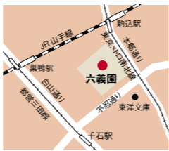
【所在地】 東京都文京区本駒込 6丁目

五代將軍徳川綱吉に仕えた柳沢吉保の下屋敷跡。造園当時から小石川後楽園と並んで江戸の二大庭園に数えられていたものを岩崎彌太郎(三菱初代社長)が買い取り、日本庭園として整備しました。久彌が新婚時代を過ごした地でもあります。1938年、久彌が市民のための公園にと東京市(当時)へ寄付しました。1953年には、国の特別名勝に指定されています。