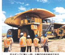
巨大ダンプに積く一掴み。大量の石炭を輸送できる

オーストラリアの経済成長に伴って、世界の鉱産資源の需要が高まっています。オーストラリアは、豊富な資源を誇る国であり、その資源の採掘は、国の経済を支えています。オーストラリアは、豊富な資源を誇る国であり、その資源の採掘は、国の経済を支えています。オーストラリアは、豊富な資源を誇る国であり、その資源の採掘は、国の経済を支えています。