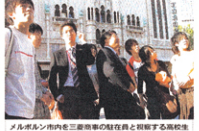
メルボルン市内を二重車線の駐在員と初顔する高校生

三菱商事は、世界を舞台に様々な事業を展開している。オーストラリアでも、石炭採掘プロジェクトをはじめ、様々な分野で事業を展開している。三菱商事は、世界を舞台に様々な事業を展開している。オーストラリアでも、石炭採掘プロジェクトをはじめ、様々な分野で事業を展開している。三菱商事は、世界を舞台に様々な事業を展開している。オーストラリアでも、石炭採掘プロジェクトをはじめ、様々な分野で事業を展開している。