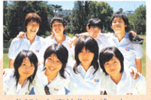
参加した高校生リポーター