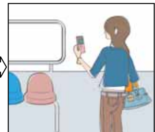
【携帯からラクラク応募】