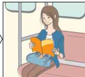
【欲しいプレゼント発見】