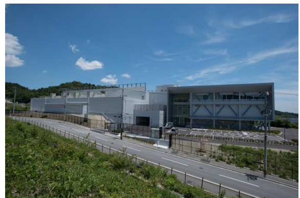
大阪彩都 DC 外観②