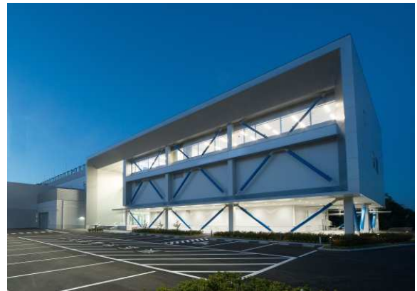
大阪彩都 DC 外観①