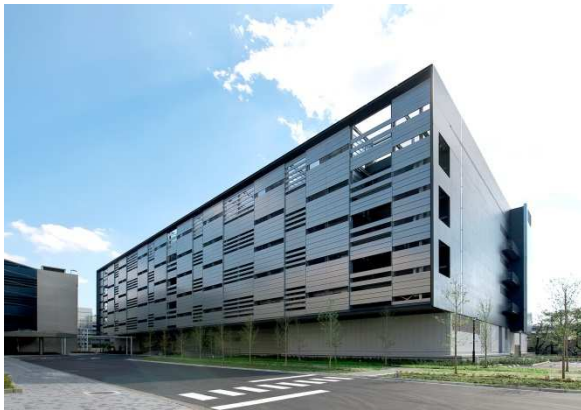
三鷹 DC 外観